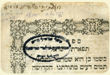
א ספר וואס האט באלאנגט פארן צדיק