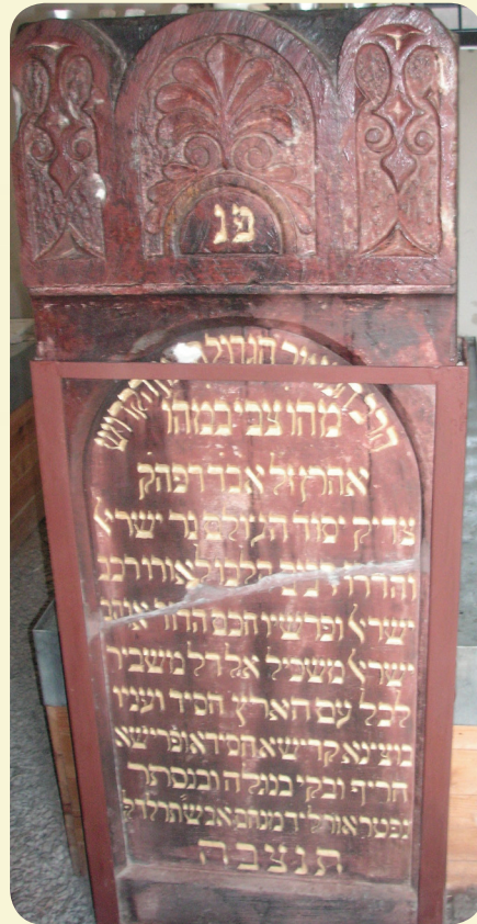
זיין ציון אין ליסקא

זאָגט אים דער רבי ר' הערש: זאָלסט נישט מיינען אַז איך האָב געזען בעסער ווי דעם אוהעלער רב און אַז ער האָט נישט געזען