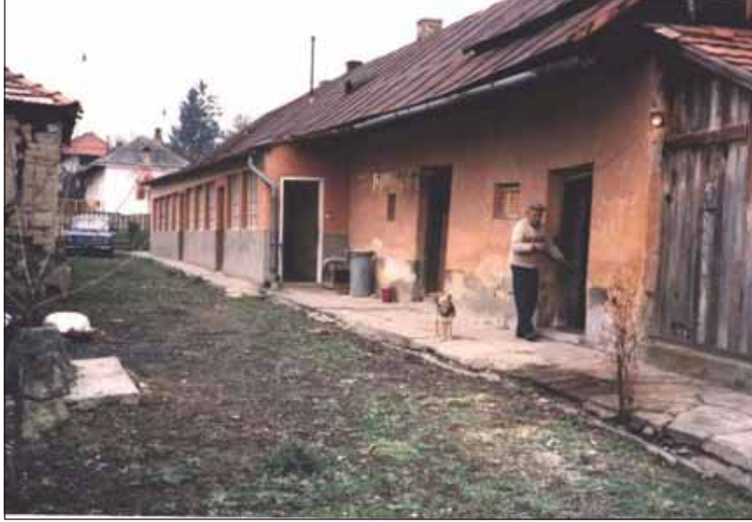
הויז פון אדמור"י ליסקא זי"ע, וואס איז חרוב געווארן אין די תש"נ יארן