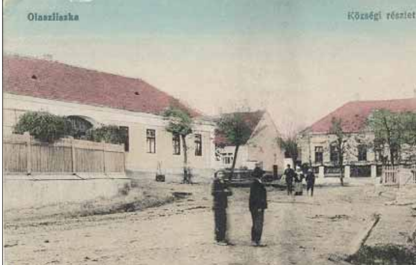
אידן אינדרויסן פון רבי'נס הויז אין ליסקא