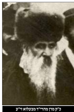
כ"ק מרן מהר"ד מבעלזא זי"ע

נחמו נחמו עמי יאמר אלקים וגו' (ישעי' מ:א, יא - הפטורה שבת נחמו)