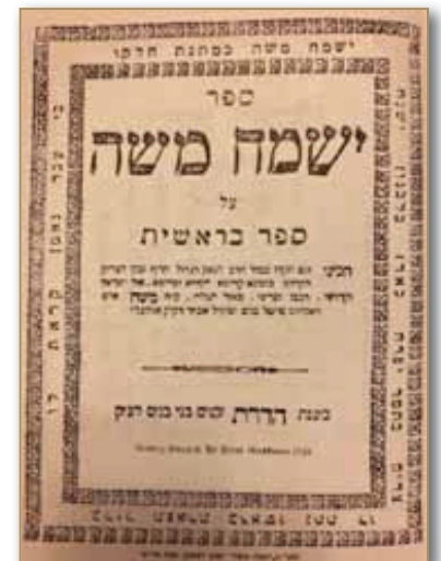
שער ה'שמח משה' דפוס ראשון שנת תר"ט

אגב, כידוע האט מען אויך ביים רבי'ן זי"ע אזוי געזען אז ער האט געהאט אן עבודה מופלגת ונפלאה ביים צעטיילן אלע געלטער, וואס איז אריינגעקומען ביי די קוויטלעך. ער האט דאס צעטיילט אין פארשידענע טאשן און צומאל האט מען אפילו געזען ווי ער נעמט א טשעק און דרייט דאס צוזאמען און פיצט זיך די אויערן דערמיט און דערנאך געווארפן אין מיסט, ווייל ער האט מרגיש געווען אז דאס איז נישט-ערליך געלט און נישט געוואלט נהנה זיין דערפון.