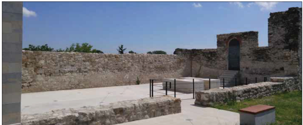
די אריגינעלע מזרח וואנט פון די שוהל, נאכ'ן איבערבויען