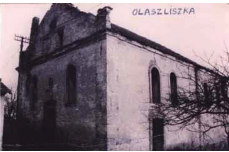
די ארגינעלע שוהל אין ליסקא