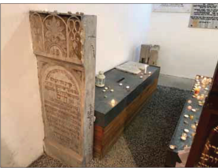
ציון פונעם בעל טל חיים מליסקא זי"ע

באקומען גרויס חשק צו פארן קיין בעלזא צום הייליגן שר שלום זי"ע, אבער אזוי אויך האב נישט געהאט קיין געלט פאר הוצאות הדרך בין איך געגאנגען דעם גאנצן וועג צופיס. ענדליך בין איך אנגעקומען צו די גרויסע שטאט לעמבערג, וואס איז שוין נישט ווייט פון בעלזא, אבער דער לאנגער וועג האט געהאט אויף מיר א ווירקונג און דארט בין איך אריינגעפאלן אין א גרויסע חולשה. די פיס זענען מיר געווארן אויפגעשוואלן און מיט גרויס שוועריגקייטן האב איך זיך דערשלעפט ביז צום בית המדרש וואס האט געהייסן "חדשים".