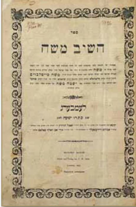
שער בלאט פונעם ערשטן דרוק פון ספר"ק השיב משה, ערשינען אין יאר תרכ"ו, נאך בחיים חיותו פון תלמידו הגדול דער אב"ד פרי תבואה זי"ע (נסתלק תרל"ד) און נכדו הגדול דער ייטב לב זי"ע (נסתלק תרמ"ד)

בשעת יענער איד האט זיך געטענה'ט מיט'ן רבי'ן זי"ע וועגן דעם געלט, האט ער געפרעגט דעם רבי'ן "אמת טאקע אז דער רבי וויל העלפן אידן, אבער וואו שטייט אז פאר איין ארעמאן דארף מען געבן אזא גרויסן סכום? נאכדערצו אין א צייט וואס מיט דעם סכום וואלט מען געקענט מח' זיין מערערע ארעמעלייט".