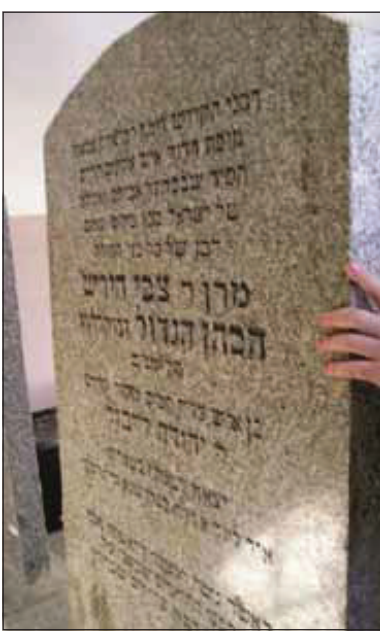
מצבת הרה"ק הרב ר' הירש מרימנוב זי"ע

אבער געקאסט 500 לעי און איך האב נישט געהאט דאס געלט. האבן גוטע פריינט מיך געראטן ווי פאלגנד: 'אין סאטמאר וואוינט דעם סיגעטער רב'ס א זון, מענטשן פרעגן אים עצות און מען ווערט געהאלפן ביי אים מיט ישועות, און אויב עס פאדערט זיך געלט, שיקט ער געלט אויך. גיי זיי זיך מוזיר ביי אים, וועסטו געהאלפן ווערן מיט אלעם, מיט א רפואה און געלט אויך...'