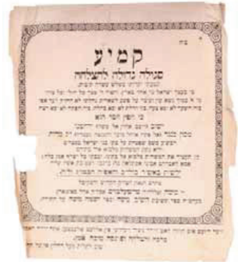
קמיע פון הגה"ק בעל ישמח משה זי"ע

ווען איך בין געווען א יונגערמאן האב איך געצויגן חיונה פון מלומדות וואס איז פארשטייט זיך געווען זייער א מצומצמ'דיגע פרנסה; ביי מיר אין שטוב האט געהערשט א שטארקע עניות. אמאל פאר'ו יום טוב שבועות האב איך