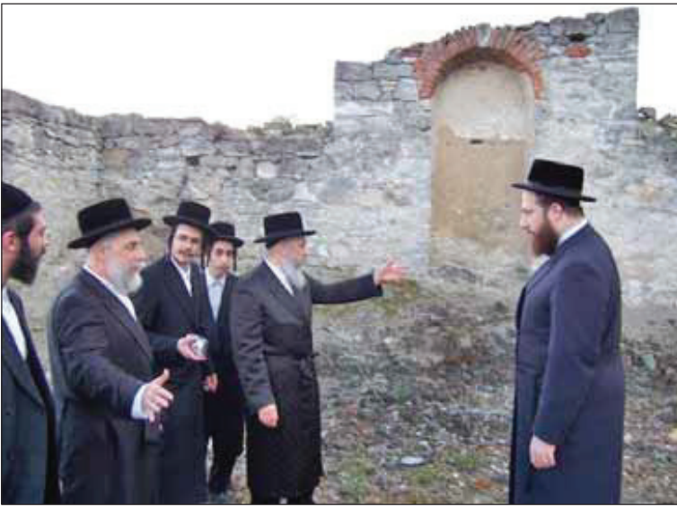
כ"ק אדמו"ר מליסקא שליט"א ואחיו כ"ק אדמו"ר מהיבנוב שליט"א אין די שוהל

דורכדיינגליכן בליק, דער ליסקא רבי האט אנגעהויבן וויינען און אויך דער רבי זי"ע האט געוויינט, דאן האבן זיי ווייטער געקוקט איינער אויפ'ן אנדערן מיט פארוויינטע אויגן אבער אן ארויסזאגן א ווארט. די זאך איז געווען א גרויסער וואונדער ביי אלע ארומיגע, אפילו ביי די משמשים. נאך א לענגערע ווילע האט דער ליסקא רבי זיך אויפגעשטעלט און זיך געזעגענט פונעם רבי'ן זי"ע.