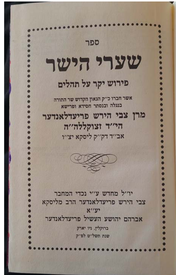
דער ספר תהלים ווי ס'איז איבערגעדרוקט געוואָרן דורך נכדי המחבר

"דער שמש פלעגט עטליכע מאל קלאָפן מיט זיין דיקן