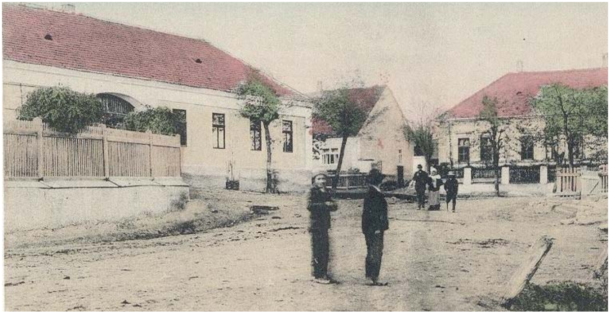
אַן אַלטער פּאַסט קאַרטל פון די שטאַט ליסקא

ולסיים מעין הפתיחה, צום ציון פונעם שיעור הישר קען מען טאַקע ליידער נישט פאַרן, "ולא ידע איש את קבורתו עד היום הזה". אבער דער געפיל איז אַז ביים ציון הקדוש און ליסקא, דאָס אָרט וואו דער שיעור הישר זצ"ל האָט "גערוקט ווענט" צו מאַכן פּלאַץ פאַר זיין טאַטן דעם טל חיים צוק"ל, אז איצט ווען דער מקום קדוש איז אַריבער געגאַנגען אונטער קהלה קדושה ליסקא וועט זיין "מה כאן עומד ומתפלל אף שם עומד ומתפלל"; ער וועט זיכער אויך אויבן אין הימל "רוקן ווענט" צו פּועל'ן ישועות ורפואות פאר אידישע קינדער און די גאולה שלימה בקרוב.